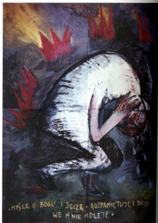
Paweł Kowalewski, Myślę o Bogu i jęczę, rozpamiętuje i duch we mnie mdleje , 1985, wł. autora, kat. 525.