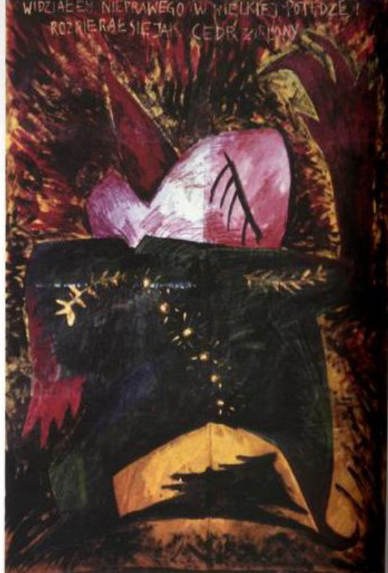
Paweł Kowalewski, Widziałem nieprawego w wielkiej potędze, rozpiął się jak cedr zielony , 1985, wł. autora, kat. 526.