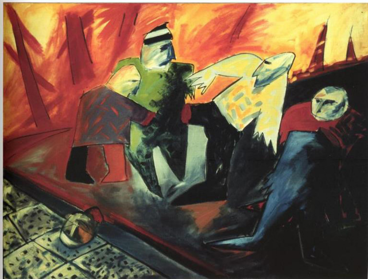
Paweł Kowalewski, Grupa czyli sześć złotych pędzli , 1986/87, wł. Muzeum Okręgowe, Bydgoszcz, kat. 527.