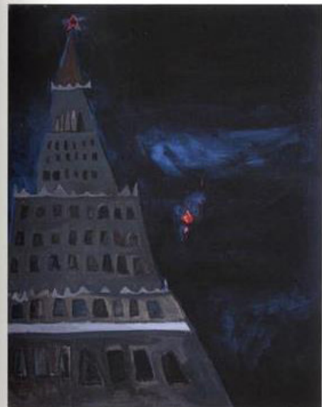
Paweł Kowalewski, Zdżicho skacze co noc z butelkami z benzyną , 1982, wł. Wojciech Włodarczyk, kat. 523.